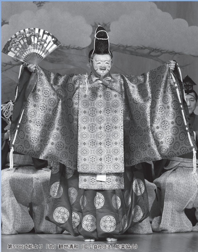
第59回式能より「翁」観世清和